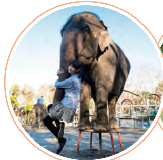
ANIMAL WONDER REZORT 「市原ぞうの国」

※「上総鶴舞・高滝周遊乗車券」で周遊バスにご乗車いただける区間は、上総牛久駅~湖畔美術館となります。