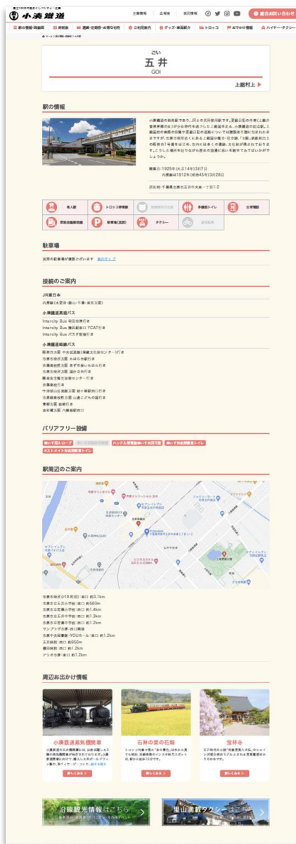
■各駅の詳細情報ページ ※画像は制作中のものです。

など、数々の機能を盛り込んだ「オニオンCMS」を採用することで、店舗・企業から簡単に登録・再編集が可能となります。これを各企業・店舗のプロモーションに活用していただけるオープンなプラットフォームとすることで、地域活性化の起爆剤となることを目指します。なお、スマートフォンからも記事を投稿・編集することができます。