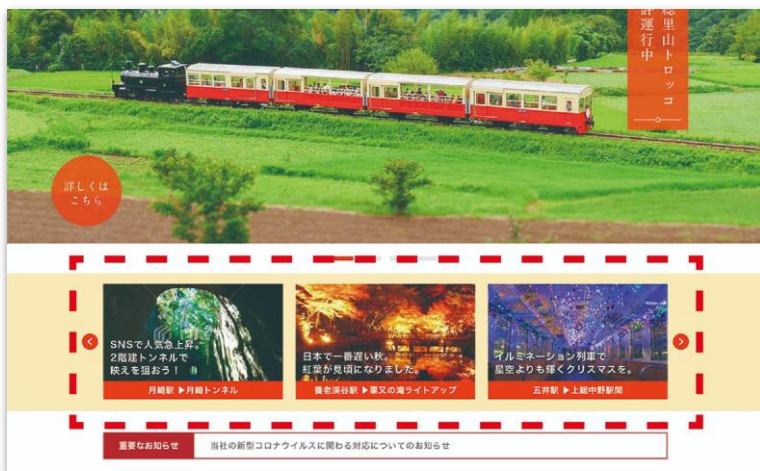
■スライドバナー（赤枠部）※画像は制作中のものです。