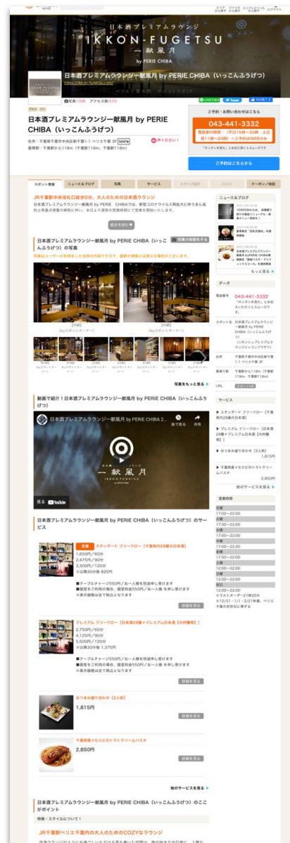
■沿線の観光スポット・店舗の個別情報ページ ※画像はイメージです。