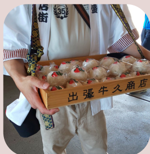
上総牛久駅 牛久商店街 牛久饅頭