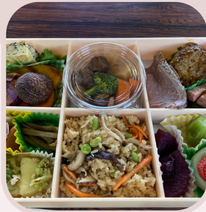
団体様用 里山弁当