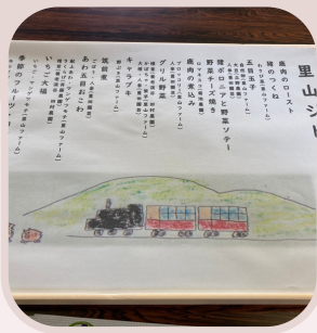
団体様用 ジビエ懐石弁当