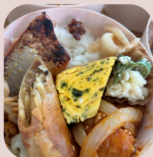
五井駅 とらんとらん 特製お弁当