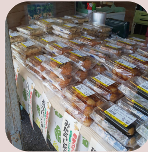
養老溪谷駅 里山ファーム 名物里山ジェラート