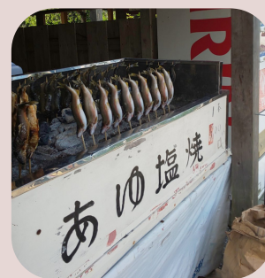
養老溪谷駅 養老川漁業協同組合 鮎の塩焼き

お問い合わせ先 料理工房とらんとらん TEL: 0436-67-1919 ※3日前までに要予約