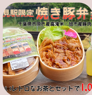
里見駅 喜動房倶楽部 焼き豚弁当