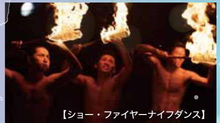
【ショー・ファイヤーナイフダンス】