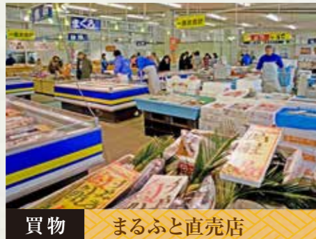
買物 まるふと直売店

東北の湘南といわれるいわき市の国際港東端の岬、海上46mの台地に立つ塔屋59.99mの展望塔です。下から一気にエレベータで上がり展望台のスカイデッキではいわき一円が一望でき、朝の潮風にあたりながら太平洋の眺めをお楽しみ下さい。