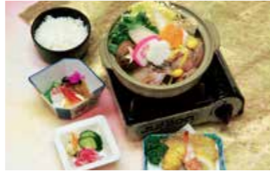
2日目昼食 / 水戸ドライブイン

集合場所・出発時刻 各出発時刻の10分前迄にご集合下さい。 ※下記集合場所以外はお乗車できませんのでご注意ください。