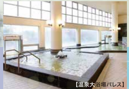
【温泉大浴場パレス】