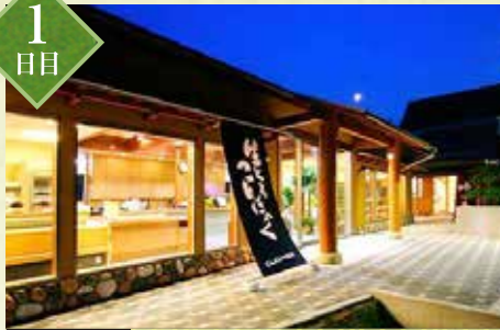
立寄 こんやく関所

奥久慈の気候と水が育んだ厳選素材の手作りこんやく。最高級素材を用い、熟練の職人が手間を惜しまず作った逸品ばかりです。試食コーナーで地元の食を味わってみてください。