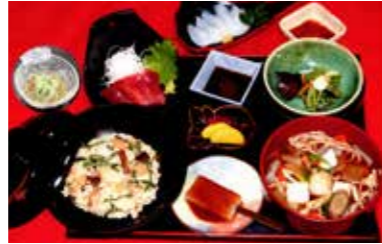
1日目昼食 / 袋田の滝 新滝