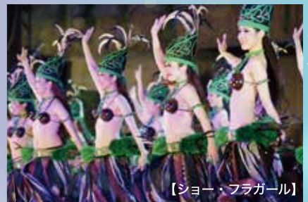
【ショー・フラガール】