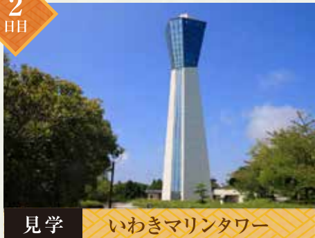
見学 いわきマリンタワー

東北の湘南といわれるいわき市の国際港東端の岬、海上46mの台地に立つ塔屋59.99mの展望塔です。下から一気にエレベータで上がり展望台のスカイデッキではいわき一円が一望でき、朝の潮風にあたりながら太平洋の眺めをお楽しみ下さい。