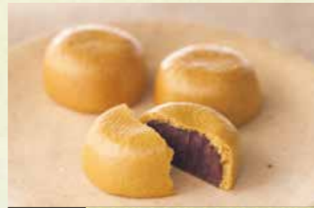
立寄 柏屋 薄皮饅頭

日本三名瀑のひとつに数えられる「袋田の滝」は、大子町は元より茨城県が誇る観光名所。平安時代の歌僧・西行法師は袋田の滝を見て、「花もみち 経緯にして 山姫の 錦織出す 袋田の瀧」と詠い、その魅力を称えました。運が良ければ氷瀑も見る事が出来るかも。