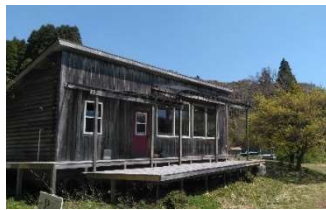
Ma i Cafe

田園風景の中で、地元食材を使った昼膳（要予約）や本格チョコレートのデザートが楽しめます。木～日営業。0436-96-1275