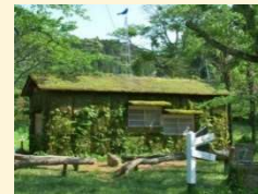
森ラジオステーション

世界的な建築家である藤本壮介氏によるアート作品。茶色の壁の中全てが定員1名の女性専用トイレです。