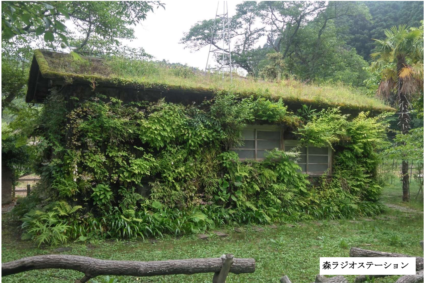
森ラジオステーション

3年毎にアートイベントが開催される南いちはらエリアのアートスポットをくまなく巡る観光タクシーです。効率的に、ワガママに、臨機応変に、あなただけの特別な旅をサポートします。