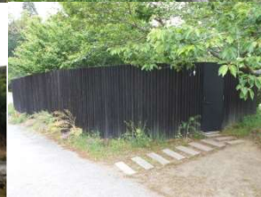
世界一大きなトイレ